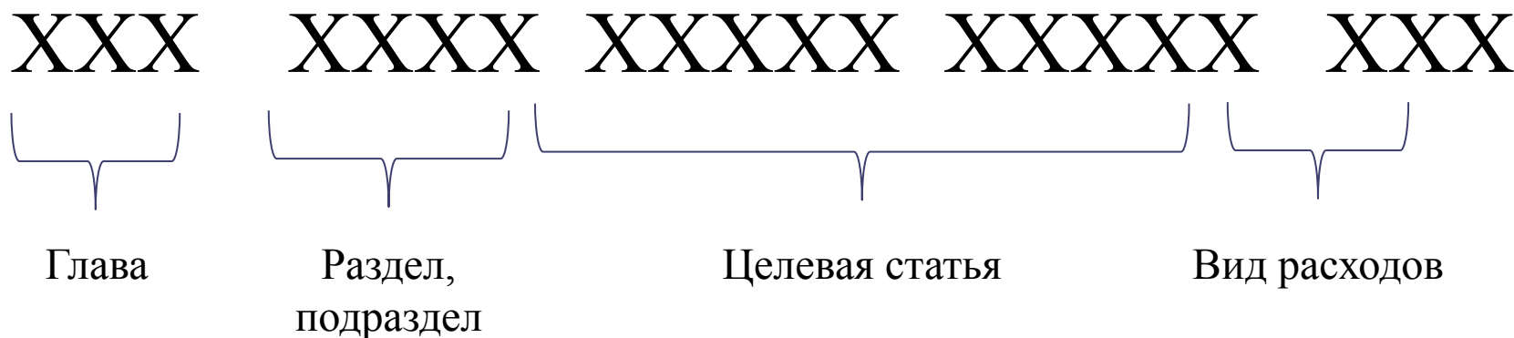
Структура кода классификации расходов бюджетов

Указания о порядке применения бюджетной классификации Российской Федерации, утвержденные приказом Минфина России от 1 июля 2013 г. № 65н (ред. Приказа Минфина России от 8 июня 2015 г. № 90н)